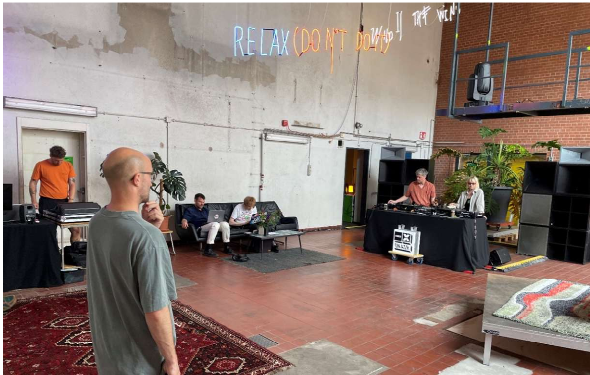
Hat das Zeug zum neuen Hotspot (Basler Zeitung) am Art-Himmel: OMG, Franck! wurde von Radio X mitlanciert und -kuratiert.

Per 1. Januar 2025 begann die neue, bis 31. Dezember 2034 währende Konzessionsperiode von Radio X. Die Konzession mit Leistungsauftrag und Abgabenanteil findet sich hier . Im Dezember 2025 entschied das Parlament, auf die Abschaltung von UKW zu verzichten. Radio X setzte sich stets für die Fortführung – wie in unseren Nachbarländern – der bewährten Technologie ein.