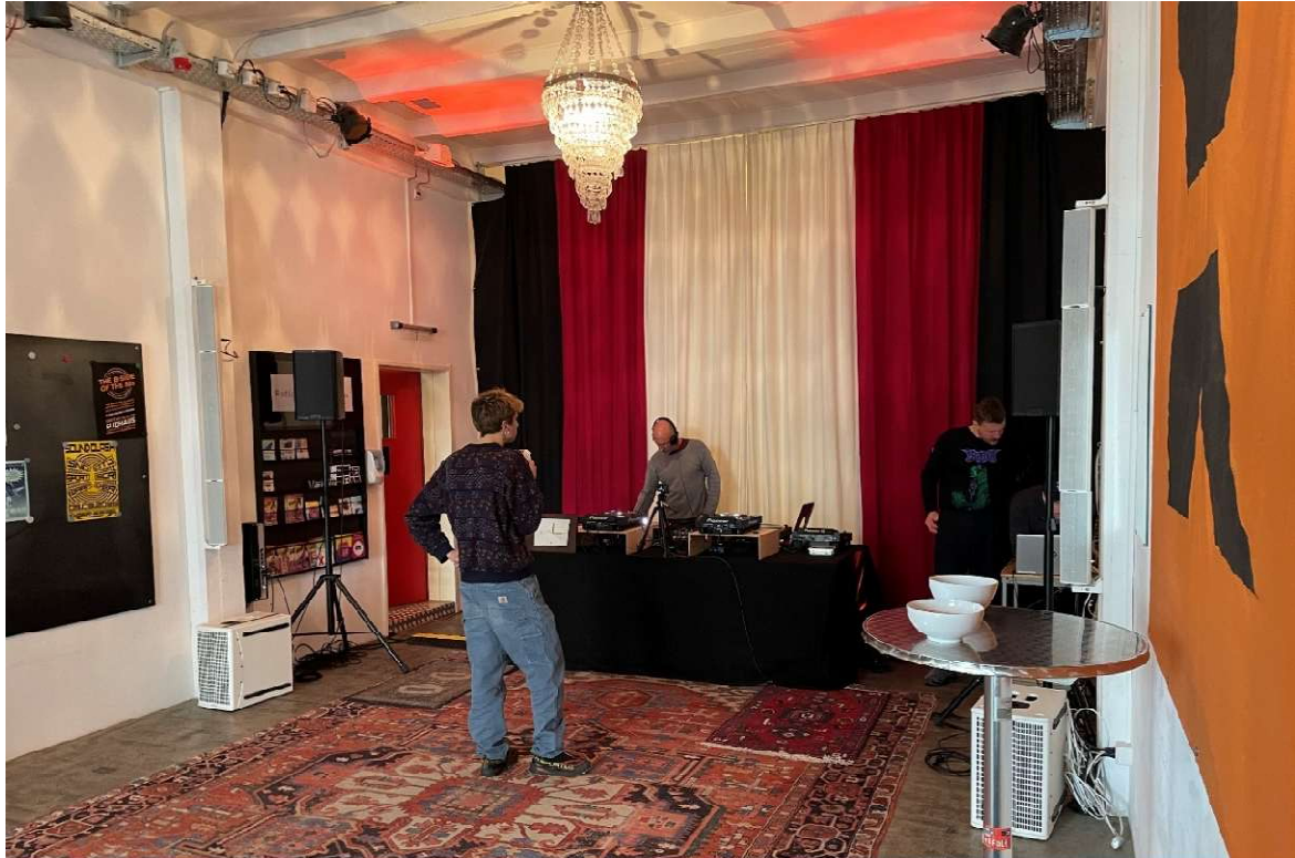
Alles bereit in der Radio X-Lounge für die jährlichen DJ-Sessions der Fasnachtsfreien Zone.