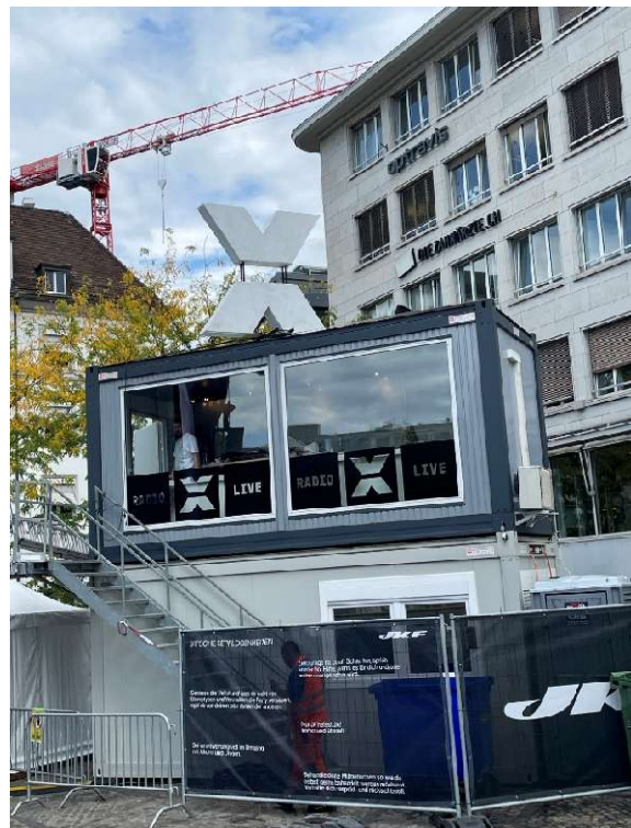
Ikone der Basler Jugendkultur: der JKF-Übertragungscontainer auf dem Barfi.