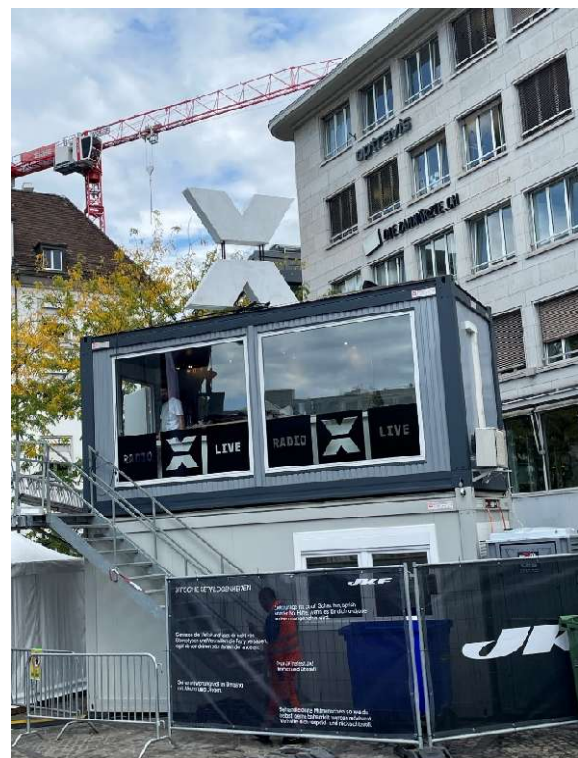
Ikone der Basler Jugendkultur: der JKF-Übertragungscontainer auf dem Barfi.