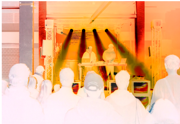
25 Jahre Radio X: X_Arts Festival auf dem Dreispitz: am 20. & 21. Oktober 2023 - Konzert Atrice.

Am 14. Juni spannten Vertreter:innen von Community-Radios in Basel, Aarau, Bern, Chiasso, Genf, Schaffhausen, Winterthur und Zürich zusammen, um dem Feministischen Streik eine laute FINTA*-Stimme zu verleihen! Ab Mitternacht wurden die Sender «gekapert», während 24 Stunden wurde ein gemeinsames Spezialprogramm auf den Frequenzen der beteiligten Radios verbreitet: das Feministische Streikradio. In über zehn Sprachen von Deutsch über Französisch bis Arabisch gab es Interviews und Beiträge zu Themen wie tiefe Löhne in Frauenberufen, sexualisierte Gewalt, Gendermedizin oder Frauenrechte im Mittleren Osten. Zwischen 11 und 22 Uhr wurde live vom Bundesplatz in Bern gesendet, Reden und Konzerte übertragen und in verschiedene Regionen der Schweiz geschaltet. Des Weiteren lief während 24 Stunden nur Musik von FINTA*-Personen.