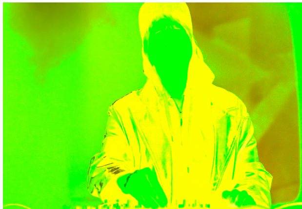
25 Jahre Radio X: X_Arts Festival auf dem Dreispitz: am 20. & 21. Oktober 2023 - Konzert delphi.