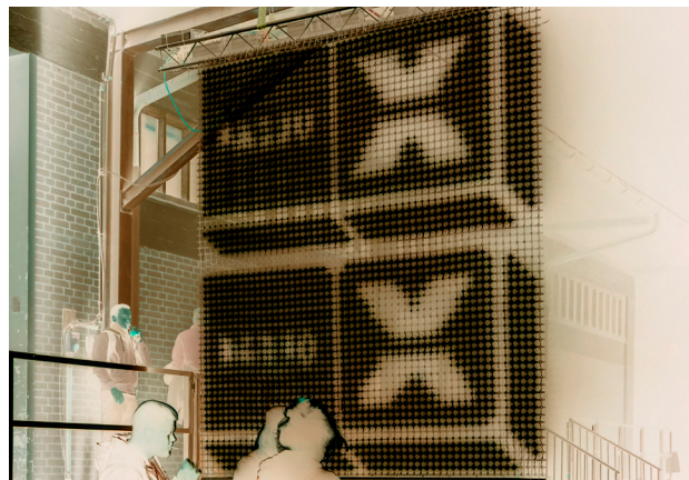
25 Jahre Radio X: Open Air Konzerte, 22. April 2023 - Eingang Transbona Halle.

Das Projekt wurde unter anderem ermöglicht durch die finanzielle Unterstützung der Christoph Merian Stiftung und der Binding Stiftung.