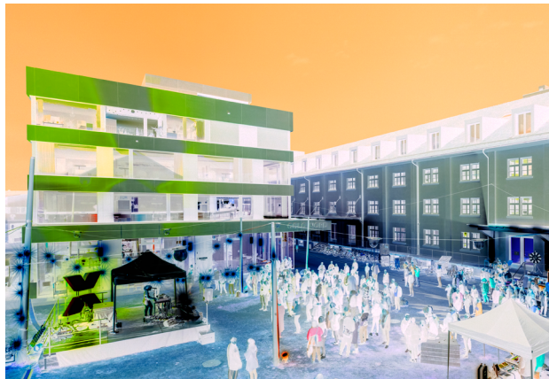
25 Jahre Radio X: Open Air Konzerte, 22. April 2023 - Konzert Anna Aaron.

2023 ging Radio X rund 20 Medienpartnerschaften mit Kulturveranstalter:innen der Region ein. Dazu gehörten u.a. das Europ. Jugendchorfestival, das Offbeat Jazzfestival, der Bandwettbewerb band-Xnordwest, das Bildrausch Festival, die Internationalen Kurzfilmtage Winterthur, das Gässli Film Festival, die Kaserne Basel, das Theater Basel, das Roxy Birsfelden und das Z7 in Pratteln. Eine enge Zusammenarbeit bestand auch mit dem Museum der Kulturen und der Hochschule für Gestaltung und Kunst HGK FHNW.